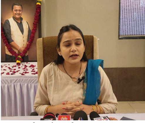
पत्नी, मुले, वकील, डॉक्टरसह ६ जणांवर गुन्हा दाखल