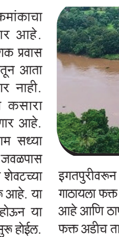
इगतपुरीवरून ठाणे किंवा आमणे गाठायला फक्त सवा तास लागणार आहे आणि ठाणे ते नाशिक प्रवास फक्त अडीच तासांमध्ये पूर्ण करता

राज्यातील दुसऱ्या क्रमांकाचा मोठा बोगदा असणार आहे. त्यामुळे ठाणे ते नाशिक प्रवास करताना कसारा घाटातून आता याशिवाय, प्रवासात कसारा घाटदेखील टाळता येणार आहे. समृद्धी महामार्गाचे काम सध्या खूप वेगाने सुरू असून जवळपास 'इगतपुरी ते आमणे' या शेवटच्या टप्प्याचे काम सध्या सुरू आहे. या टप्प्याचे कामही पूर्ण होऊन या ठिकाणी नवीन वाहतूक सुरू होईल.