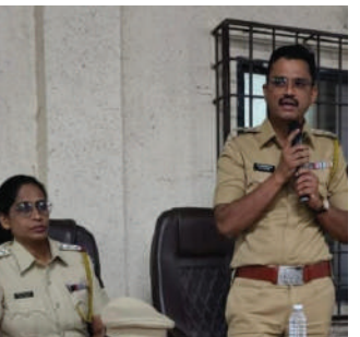
पोलीस मित्र म्हणून आपण ही जबाबदारी पार पडतात. आपले आसपास काय घडते यावर लक्ष असावे. आपण आमचे सोबत असल्यामुळे आम्हाला प्रत्येक

द. ठाणे जीवनदीप वार्ता/ ठाणे (प्रतिनिधी) : परिसर गुन्हेगारी मुक्त कसा राहील यासाठी पोलीस कायम प्रयत्न करत असतात. त्यासाठी समाजातील अनेक घटक सिद्धील ड्रेस मध्ये पोलिसांचे खांद्याला खांद्या लावून काम करतात. अनेक गोष्टी आमच्यापेक्षा तुम्हाला माहित असतात अशा गोष्टीची आम्हाला माहिती पडल्यात म्हणून जागरूक नागरिक म्हणून तुम्ही तुमचे नागरी कर्तव्य पार पाडावे. समाजातील विविध सण उत्सवांमध्ये आपण सर्वजण सोबत काम करतो.