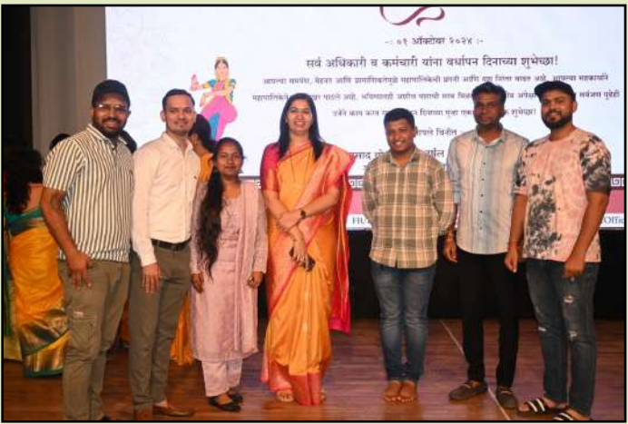
○ द.ठाणे जीवनदीप वार्ता ○

कल्याण : कल्याण डॉंबिवली महानगरपालिका, कल्याण क्रीडा विभागामार्फत महापालिका वर्धापन दिनाचे औचित्य साधून महापालिका वर्धापन दिन सोहळा आचार्य अत्रे रंगमंदिर येथे मोठ्या उत्साहात साजरा झाला.