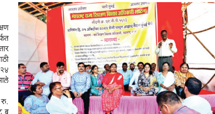
सर्वंग (पद) शालेय शिक्षण विभागाकडे हस्तांतरित करावे व या पदास सामान्य यांना काही जिल्ह्यात वेतनवाढ दिली जात नाही तसेच पाच वर्षांनी श्रेणी २ वर पदोन्नती व अनुषंगिक लाभ

मुरबाड : महाराष्ट्र राज्य शिक्षण विस्तार अधिकारी संघटना यांच्यामार्फत राज्यातील सर्व शिक्षण विस्तार अधिकारी यांच्या प्रलंबित मागण्यांसाठी बेमुदत उपोषण ५ ऑक्टोबर २०२४ पासून आझाद मैदान मुंबई येथे सुरु झाले आहे. या उपोषणात कायम प्रवास भक्ता वेतनासोबत रु. ८०००/- मिळावा, शिक्षण सेवा गट ब प्रशासन शाखा पदोन्नतीचे प्रमाण ८०% करावे, शिक्षण सेवा गट ब ची पदोन्नती प्रक्रीया तात्काळ पूर्ण करावी. त्यासाठी सेवाजेष्ठता यादी तात्काळ प्रसिद्ध करावी, शिक्षण विस्तार अधिकारी,