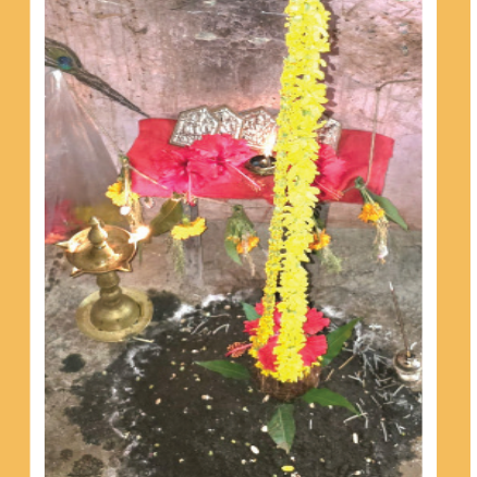
मुरबाड : मुरबाड तालुक्यातील ग्रामीण तसेच आदिवासी पडद्यात व मुरबाड परिसरात नवरात्रीसवात दुर्गा मातेची प्राणप्रतिष्ठापना करण्यात आले आहे त्याचबरोबर ग्रामीण भागात प्रत्येक घरी असणारे कुलदैवत त्याला विशेष महत्त्व दिले जाते त्या दिवशी घटक बसविले जिथे म्हणजेच घट स्थापना बोलले जात आहे. त्या दिवशी घरातील कुलदैवतासमोर विविध प्रकारची नऊ कडधान पेरली जातात व प्रत्येक दिवशी कुल दैवत समोर तांब्याच्या कळसावर नारळ ठेवून वरती खुरक्षणाच्या पिवळ्या फुलांची माळ टांगली जाते अशा प्रकारे नऊ दिवस नऊ मळा टांगल्या जातात ही परंपरा ग्रामीण भागात आजही विशेष नाही विशेष मानली जात आहे. त्याचबरोबर घंटाची विशेष घरोघरी पुजापाठ केली जात आहे.