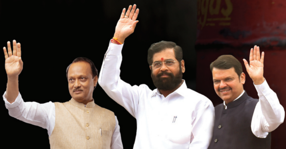
अजित पवार उपमुख्यमंत्री