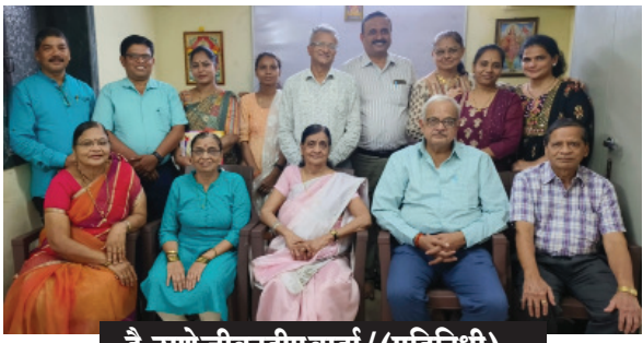
दै.ठाणे जीवनदीप वार्ता / (प्रतिनिधी) -

'काव्य किरण मंडळ, कल्याण' या मंडळाचा मासिक साहित्यिक मेळावा रविवार दिनांक २९ सप्टेंबर, २०२४ रोजी सायंकाळी ५.०० ते ८.०० या वेळेत कल्याण येथील लोक मंगलम् संस्थेच्या कार्यालयात संपन्न झाला.