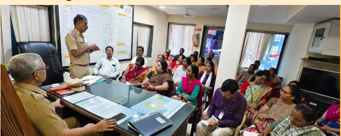
○ द.ठाणे जीवनदीप वार्ता ○

प्राचार्य, मुख्याध्यापक व शिक्षकांना केले मार्गदर्शन