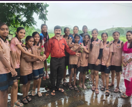
द.ठाणे जीवनदीप वार्ता