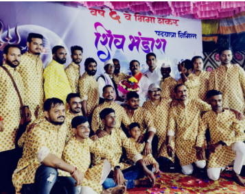
द.ठाणे जीवनदीप वार्ता :